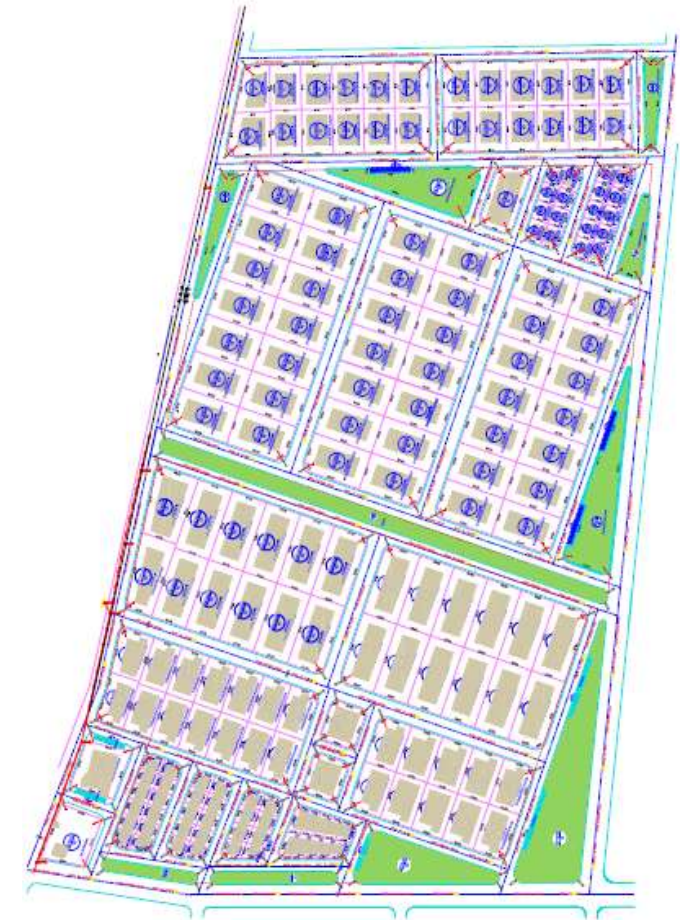
Plan de lotissement de la ZI de Nefta