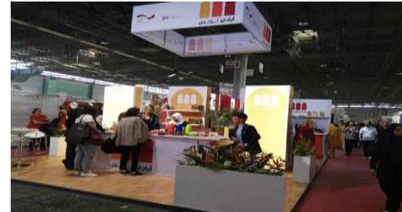
Participation de 2 promotrices en DD Foire Kram