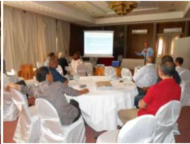
Info day sur les consortia