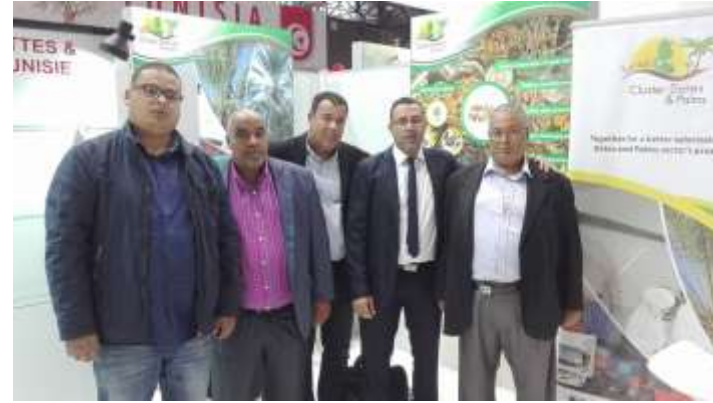
SIAL Paris Octobre 2016