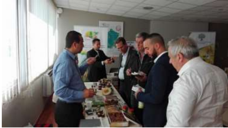
MIN Marseille et Nice Mai 2016