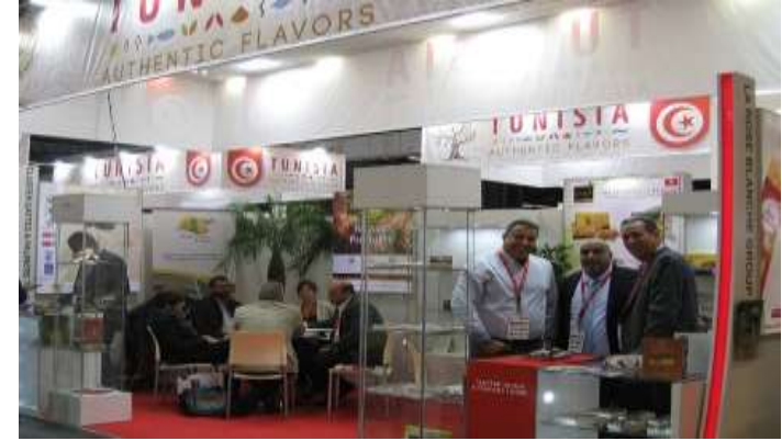
ANUGA Allemagne Octobre 2017