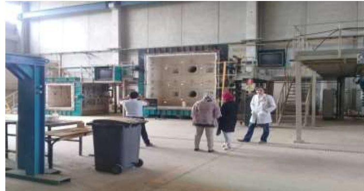
Stage techniques pour 4 promoteurs en DP en Espagne