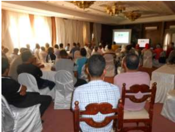
Info day sur L'AC