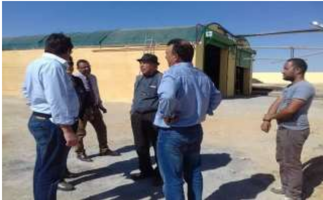
Entreprise de composte biologique