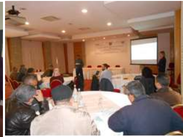
Info day sur le marché des dattes en Allemagne