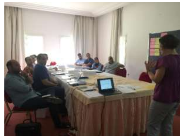
Formation préparation aux foire et salons