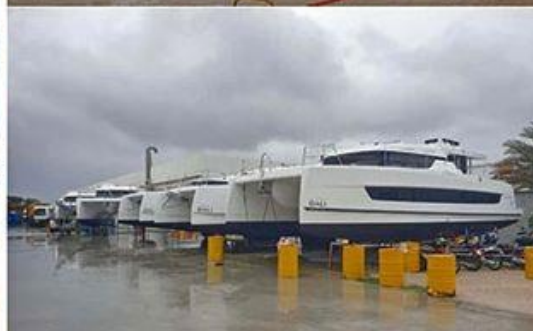
Des catamarans en attente d'exportation.

Cette tribune raconte les difficultés qu'un entrepreneur étranger, qui dirige un chantier naval à Haouaria, dans le Cap Bon, au nord-est de la Tunisie, dont la production est totalement destinée à l'exportation, rencontre avec l'administration de notre pays. Si l'on veut comprendre pourquoi l'investissement direct étranger baisse chaque année dans notre pays, il ne faut pas chercher très loin : c'est une administration stupide qui empêche la reprise économique, comme l'explique l'article ci-dessous.