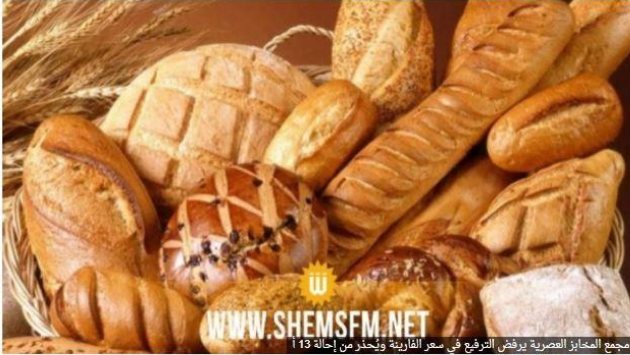
مجمع المخابز العصرية يرفض الترفيع في سعر الفارينة ويحذر من إحالة 13 ألف عامل على البطالة