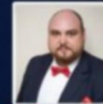
M. Marcin Wrobel Agence Polonaise pour l'Investissement et le Commerce