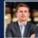
M. Marcin Puchowski Agence Polonaise pour l'Investissement et le Commerce