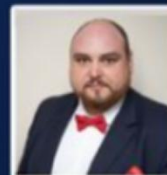
M. Maciej Wrub Agence Polonaise pour l'Investissement et le Commerce