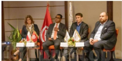
أبلغ عن صورة غير لائقة