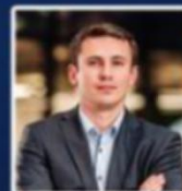
M. Maciej Peratowski Agence Polonaise pour l'Investissement et le Commerce